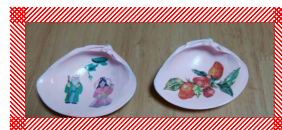
デクパージュ講座